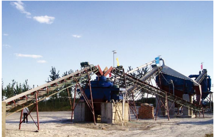
Поточные линии производимого песка 40t/h(сухая технология) 40t/h机制砂生产线（干法）

根据具体情况，机制砂的生产通常采用湿法或干法工艺，以下是两种典型的生产工艺，两种工艺均可生产出优质的机制砂产品用做混凝土骨料；特别是干法生产工艺，在高速公路路面骨料加工中，不仅能生产SMA路面中所需的机制砂，而且可以同时生产沥青混凝土中所需的石粉。